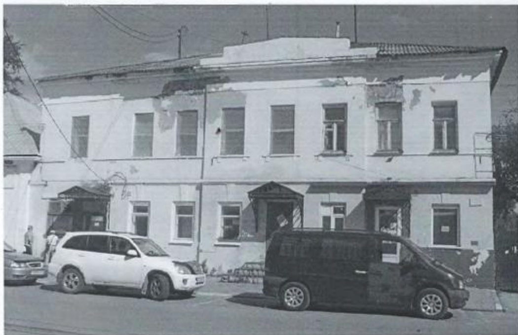
Фото 2. Главный западный фасад.