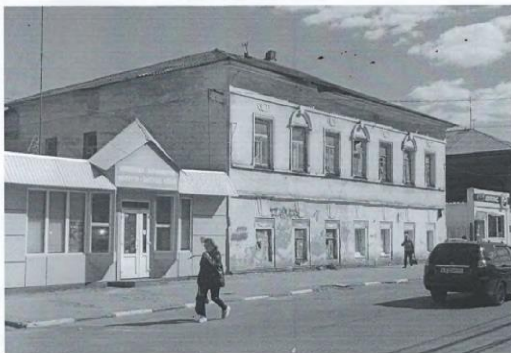
Фото 3. Вид с северо-запада.