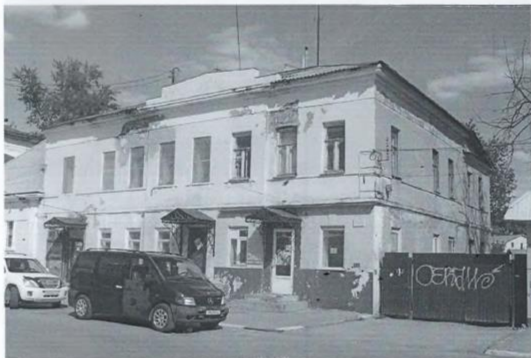
Фото 1. Вид с юго-запада.

«Доходный дом И.Ф. Духонина»,. Тульская область, город Тула, ул. Пирогова, д. 9, лит. А, А1