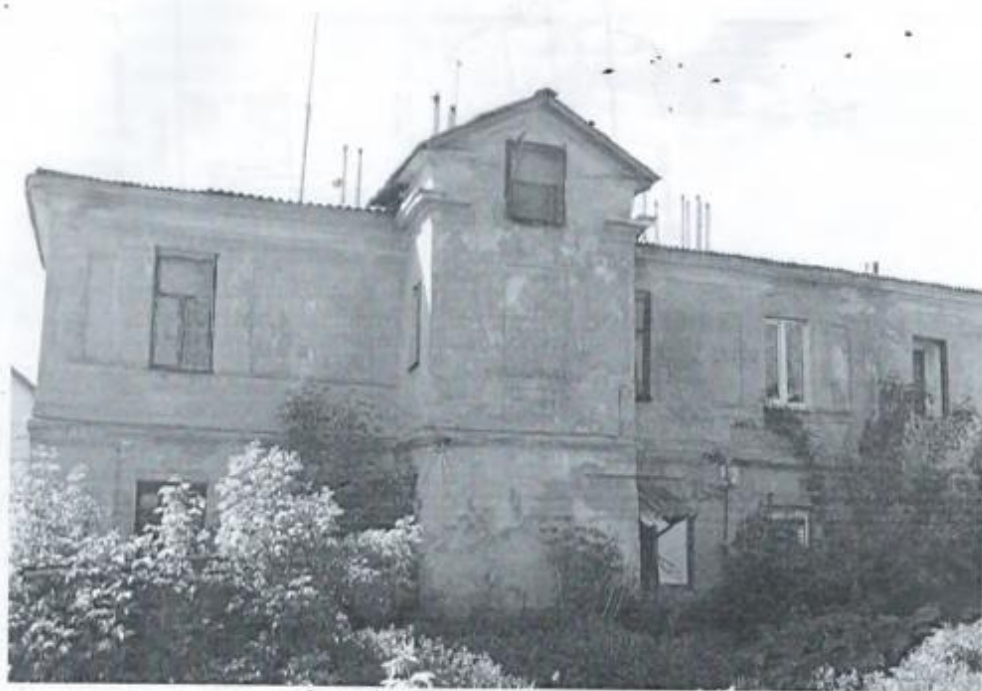
Фото 5. Восточный фасад.