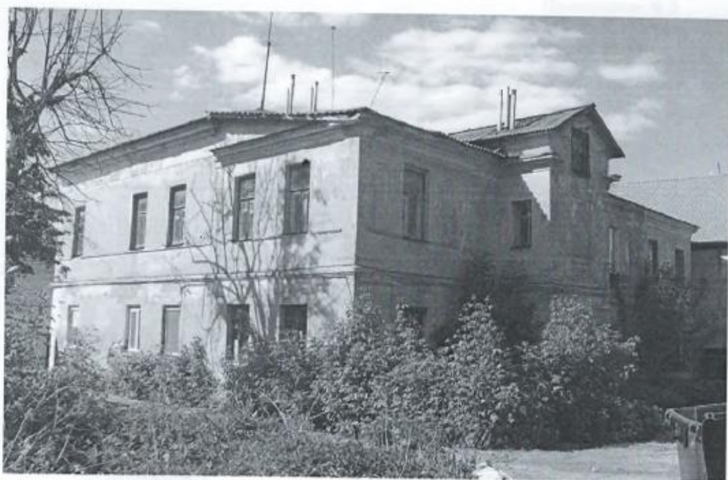
Фото 4. Вид с юго-востока.